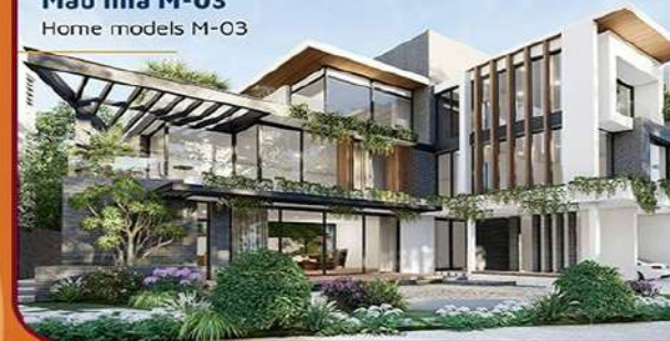
Mẫu nhà M-03 Home models M-03